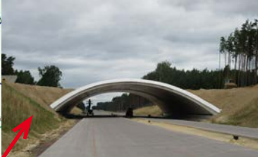
Abschnitt 5: AS Karstädt – Groß Warnow: Grünbrücke