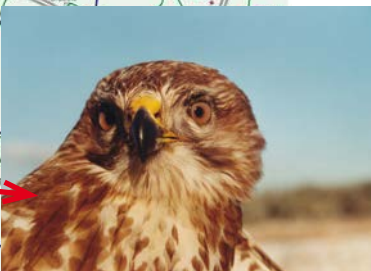
Abschnitt 4: AS Wittenberge – o AS Karstädt: Berücksichtigung des europäischen Vogelschutzgebietes „Unteres Elbtal“