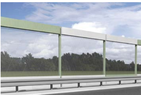
Überflugschutzhilfen und Kollisionsschutzwände (Visualisierung)