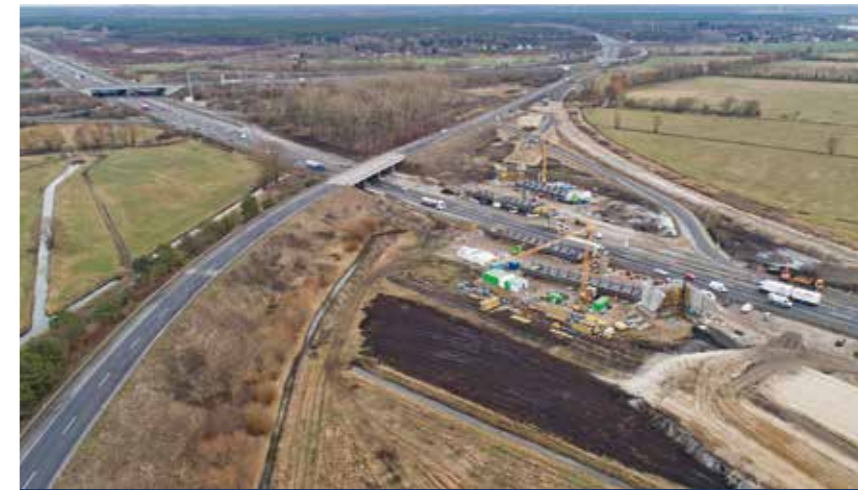
A 10/A 24, Ausbau und Erneuerung (Brandenburg)

Im Jahr 2020 soll die DEGES in der neuen Autobahn GmbH des Bundes aufgehen und als Geschäftsbereich Großprojekte die ihr übertragenen Projekte weiterführen. Die Autobahn GmbH des Bundes übernimmt ab 2021 Planung, Bau, Betrieb, Erhaltung, Finanzierung und vermögensmäßige Verwaltung der Autobahnen in Deutschland.