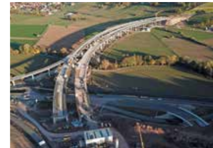
A 44, Neubau (Hessen)