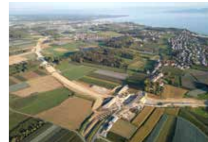
B 31neu, Verlegung (Baden-Württemberg)