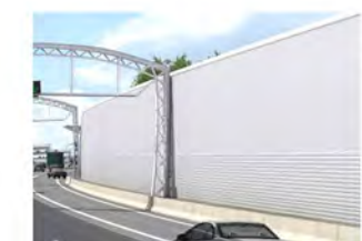
3 Einfache Lärmschutzwand