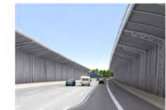
1 Beidseitig einkragende Lärmschutzwände