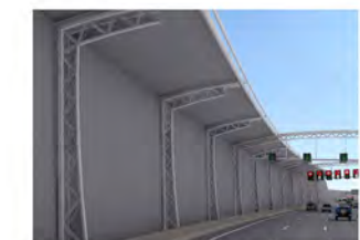
2 Einkragende Lärmschutzwand