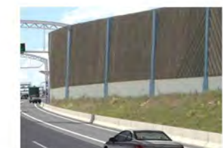
4 Lärmschutzwand auf Lärmschutzwall