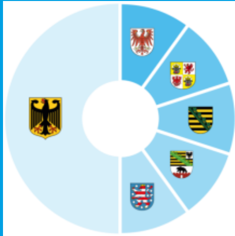
Gesellschafter der DEGES 1991