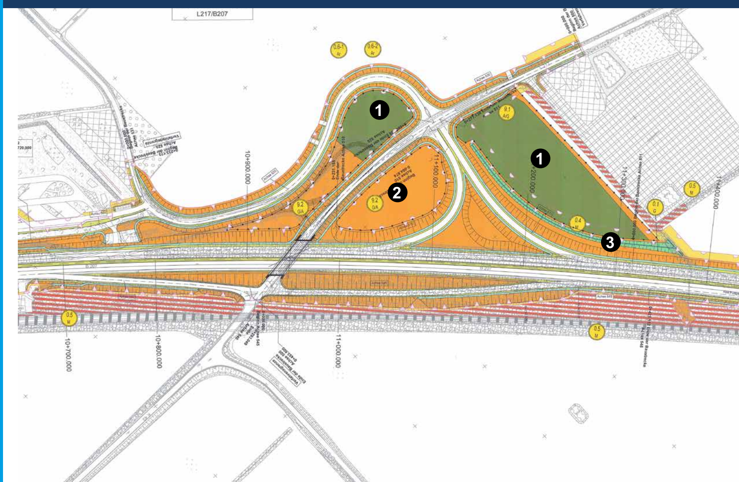
Beispiel Anschlussstelle Avendorf