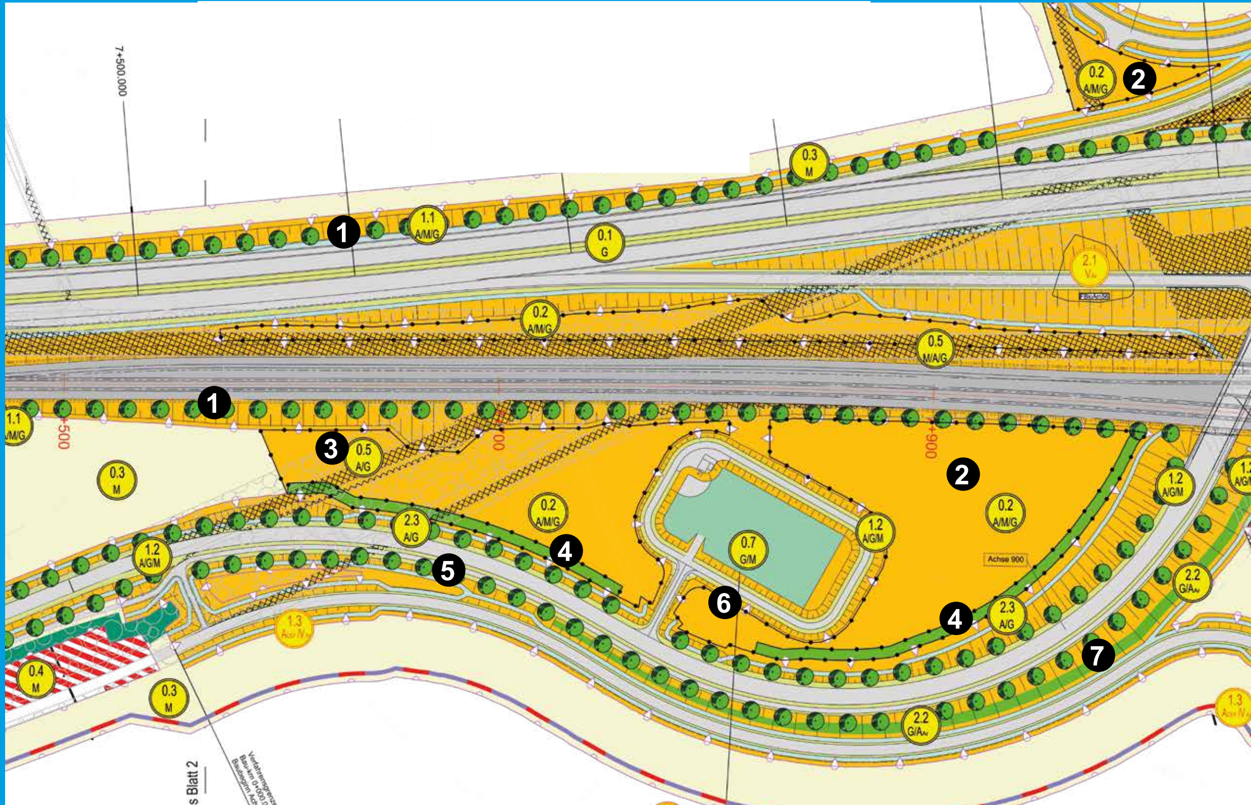
Beispiel Anschlussstelle Puttgarden