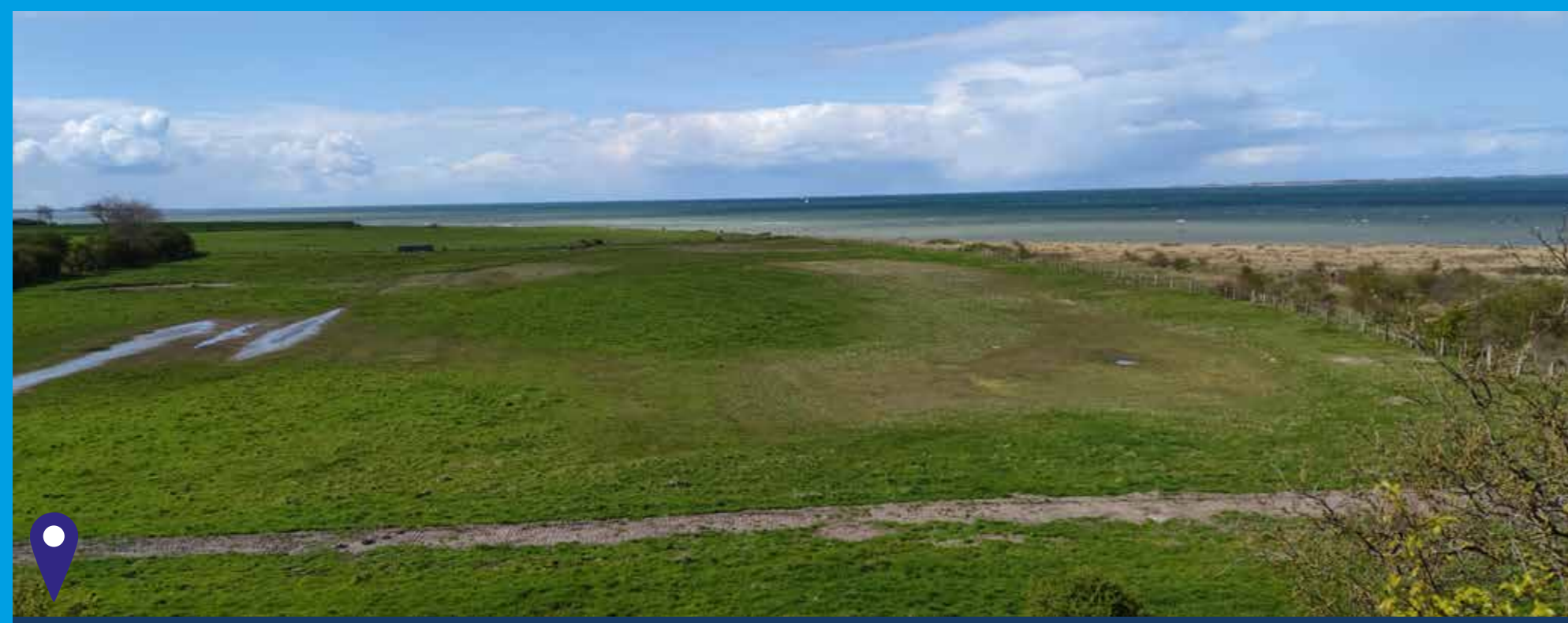
Nach der Umsetzung April 2023