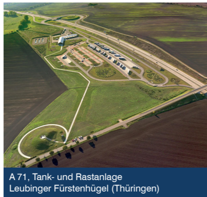
A 71, Tank- und Rastanlage Leubinger Fürstenhügel (Thüringen)

DEGES Deutsche Einheit Fernstraßenplanungs- und -bau GmbH Zimmerstraße 54 10117 Berlin