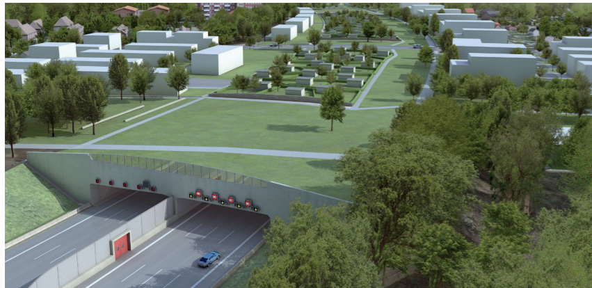
A 7, Visualisierung Nordportal Tunnel Altona (Hamburg)