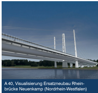
A 40, Visualisierung Ersatzneubau Rheinbrücke Neuenkamp (Nordrhein-Westfalen)